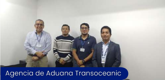
Agencia de Aduana Transoceanic