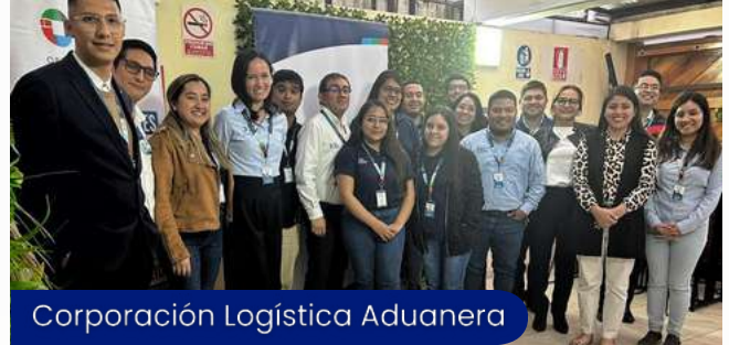
Corporación Logística Aduanera