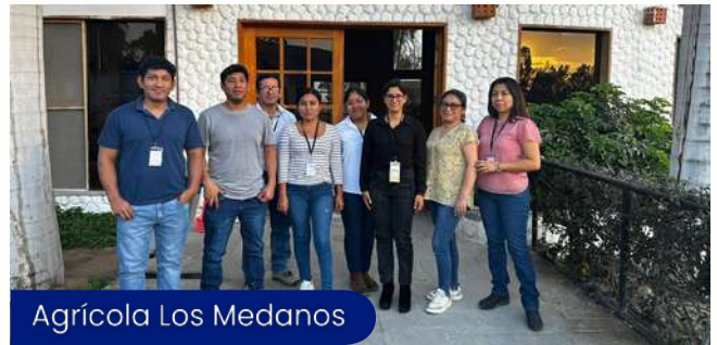
Agrícola Los Medanos