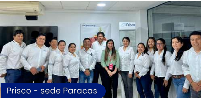
Prisco - sede Paracas